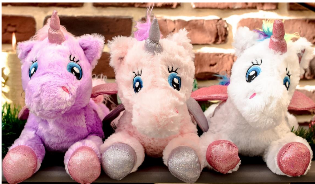
Les 3 licornes solidaires venues en aide pour les enfants atteints de cancer

Au terme d'une opération à succès, 7000 licornes à travers 12 boutiques partenaires* ont été vendues, récoltant la somme de 35 000€ .